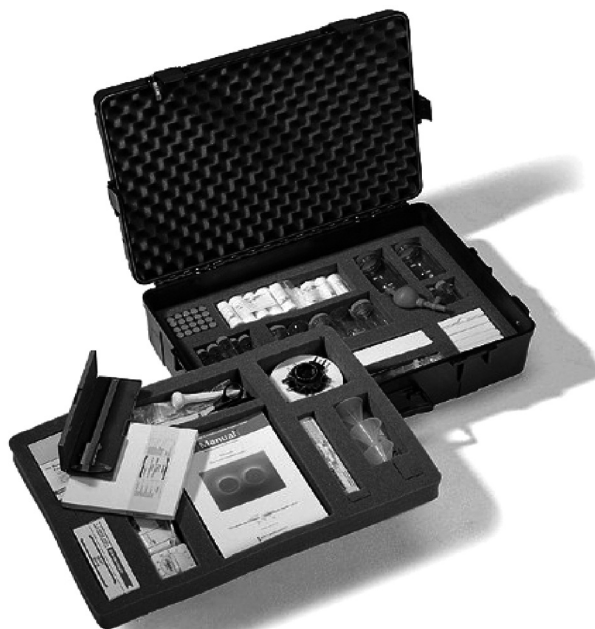
Figure 1. Le kit GPHF -MINILAB.